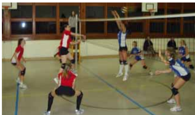
Juniorinnen A – Smash Pfeffingen