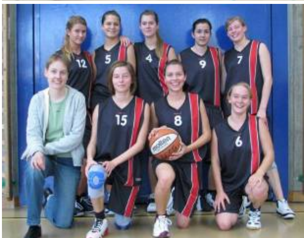
Die ungeschlagenen. Juniorinnen U15 und U17.

Die nächsten Spiele werden deshalb aber kaum zum Selbstläufer werden. Es gilt, sich nicht auf den Lorbeeren auszuruhen, da die Rückrunde tendenziell schwieriger wird. Gerade die U15 werden mit einem stärkeren Team der Bären aus Kleinbasel rechnen müssen und auch die anderen Gegnerinnen werden Fortschritte machen. Bei den U17 haben einige Spielerinnen aufgehört, so dass nur noch acht aktiv sind. Da könnten sich Absenzen und/oder Verletzungen stark auswirken. Hier wäre es wünschenswert jüngere oder neue Spielerinnen zu integrieren. Konsequentes Training wird nach wie vor entscheidend sein.