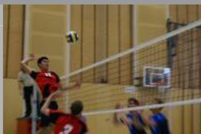
Saisonberichte | Rückblicke