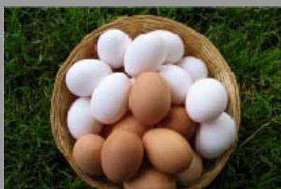
Eierleset | Eierbuffet