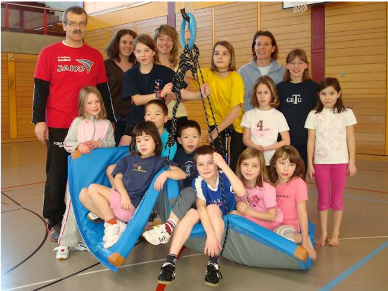
Leiter und Teilnehmer am 25. Januar 2009