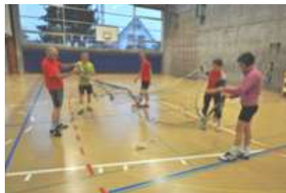
2 „Fischerinnen“ und 3 „Fischer“ beim Netz auslegen

Herzlichen Dank für die Organisation und weiterhin viel Spass!