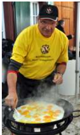
Der Küchenchef in Aktion

In vielen Gemeinden wird nach dem Wettbewerb ein sogenannter Eiertäsch (Eierspeise) zubereitet, der innerhalb des Vereins oder zusammen mit der Bevölkerung verzehrt wird. In Effingen hält der Eierpfarrer zuvor noch seine Eierpredigt. In Oeschgen wird diese Schnitzelbank „Eiertäsch“ genannt und behandelt ebenfalls Dorfgeschehnisse in Versform.