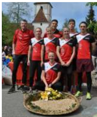
TV MuttENZ athletics

beide noch frisch und voller Tatendrang!