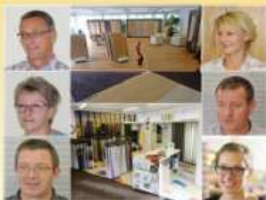
Mössinger Parkett Vorhänge