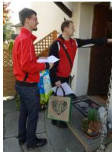
Eiereinzüger mit Liste und Tasche in Aktion. (grosser Dank an alle, die diese Aufgabe übernommen haben)

Die benötigten frischen Eier werden erst kurz vor dem Fest beschafft. Meist gehen Mitglieder des Turnvereins von Tür zu Tür und bitten um Eierspenden. Dieser Heischebrauch wird in Dintikon als „Gageln“ bezeichnet und findet ebenfalls am Samstag nach Ostern statt.