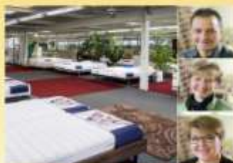
Bettenhaus Bella Luna