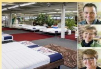
Bettenhaus Bella Luna