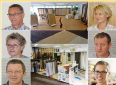
Mössinger Parkett Vorhänge