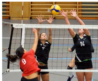
Bilder vom Cupspiel

Leider wurde auch der Mobilair Volley Cup für die Regionalteams später abgebrochen, sodass nur noch die Nationalliga A Teams die 1/8 resp. 1/4 Viertelfinals bestreiten dürfen.