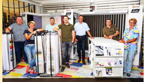
Team Mössinger AG

DieRaumausstatter.ch Mühlemattstr. 27, 4104 Oberwil Tram 10 / Bus 61+64 (Hüslimatt)