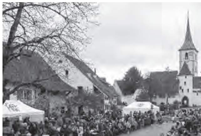
Eierleset 2023

Das geht natürlich nur mit den rund 100 Helferinnen und Helfern am Sonntag und den 57 Einzugs-teams in der Woche davor.