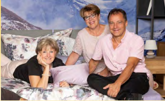
Team Bettenhaus Bella Luna