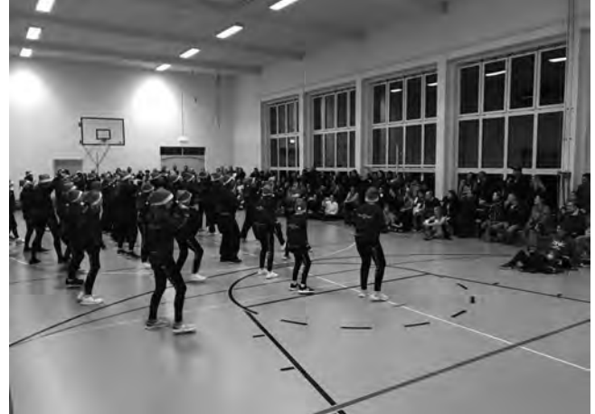
Der Schlusssauftritt von Move'n'Dance

Die vier Gruppen zeigten nacheinander was sie seit den Sommerferien gelernt haben, bevor alle zusammen den weihnächtlichen Schlusssauftritt tanzten.