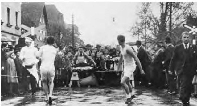
Eierleset 1938 in MuttENZ

Das Eierleset ist keine MuttENZer Erfindung. In der Nordwestschweiz gibt es diesen Frühlingsbrauch in verschiedenen Gemeinden am Weissen Sonntag. Es wird aber teilweise in einer anderen Form zelebriert. Auch in MuttENZ hat es sich über die Jahre verändert. Früher lief ein Läufer in die Lachmatt oder um die Kirche, während der andere die Eier einsammelte. Zeitweise kämpften auch drei Mannschaften um den Sieg. Seit ca. 20 Jahren findet unser Eierleset im Oberdorf, in einer attraktiven Form für die Zuschauer, statt.