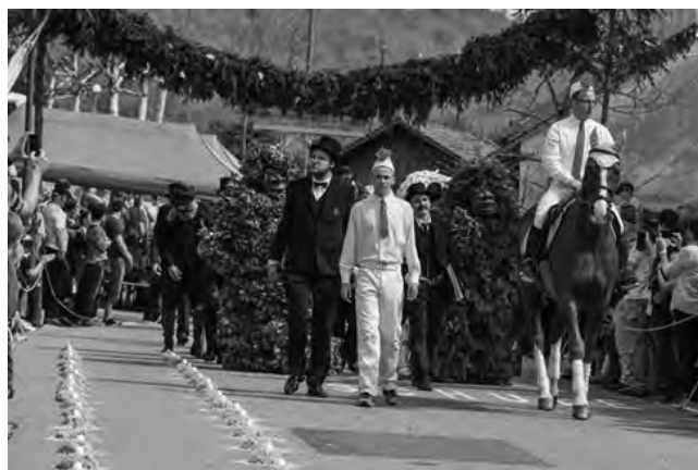
Eierleset in Effingen

Ganz anders ist das Eierleset in Effingen ( www.eierleset.ch/ )