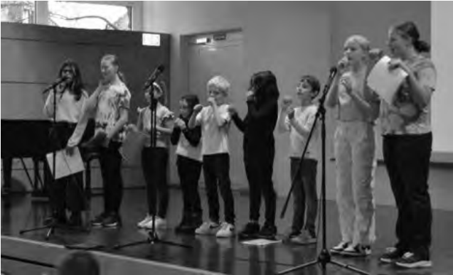
Der «Chorazon»

Am 19. November lud der TV zum vierten Mal zum TV-Brunch ein. Die Jugendriege, der Schulchor «Chorazon» und das Move'n'Dance zeigten ihr Können. Dazu gabs ein ausgedehntes z'Morge. Den rund 60 Gästen hat es gefallen. Das OK ist am Überlegen, ob es in 2 Jahren einen weiteren TV Brunch geben wird, nach 4 Anlässen brauchen wir neue Ideen.