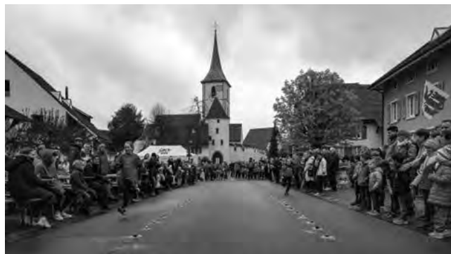
Eierleset 2023 in MuttENZ

Ganz anders ist das Eierleset in Effingen ( www.eierleset.ch/ )