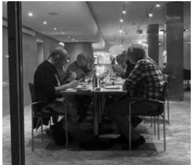
Candlelight-Dinner im Mittenza