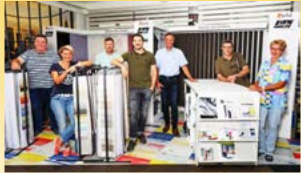
Team Mössinger AG

DieRaumausstatter.ch Mühlemattstr. 27, 4104 Oberwil Tram 10 / Bus 61+64 (Hüslimatt)