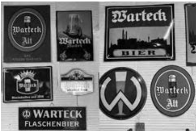
Kleiner Teil des „Wardeck-Sammelsuriums“