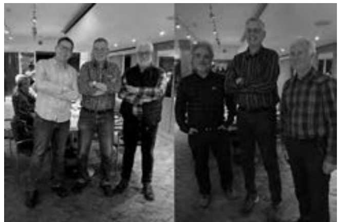
OK 2024 (links) und OK 2025 (rechts)