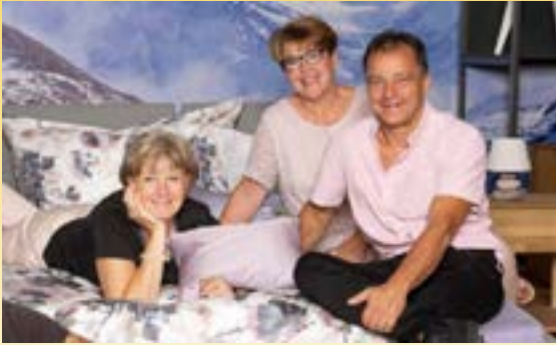
Team Bettenhaus Bella Luna