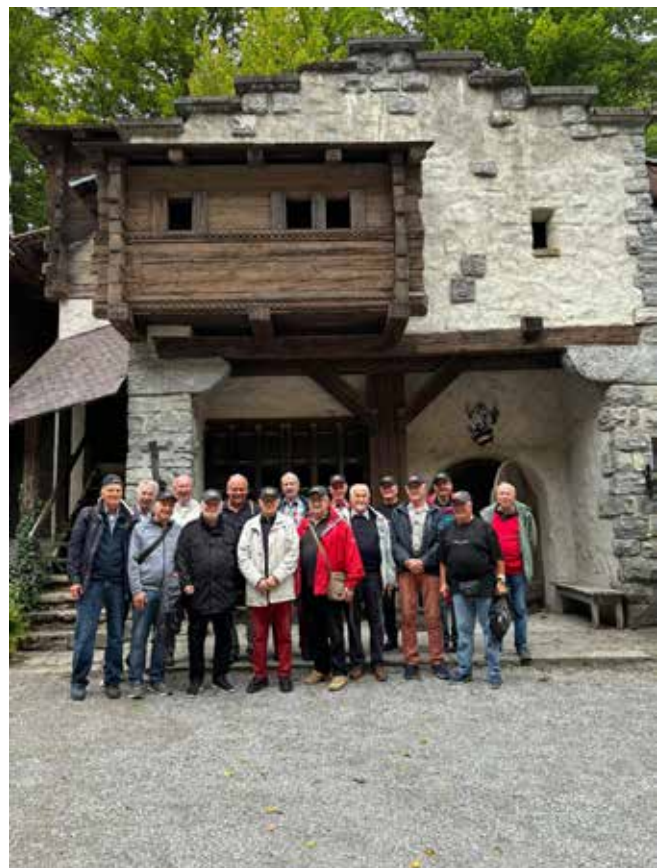
Das Fritigstrüpli auf dem Tellspielareal

Nach dem Rundgang konnten wir auf der Haupttribüne, in der VIP-Lounge, ein reichhaltiges kaltes Buffet geniessen und diverse Getränke konsumieren. Die Zeit verging wie im Flug und kaum auf unseren reservierten Plätzen eingetroffen, begann das Theaterstück «Robin Hood», eine moderne Art von Wilhelm Tell.