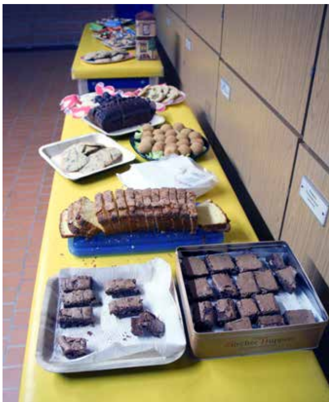
Dies war nur die eine Reihe des weihnächtlichen Buffets