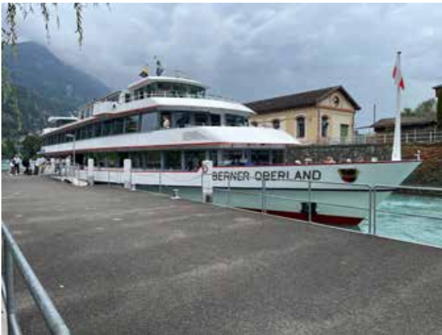
Ankunft der MS Berner Oberland in Interlaken

Am Freitag, 5. September, Bahnhof Basel, Perron 8, Besammlung unserer Truppe. Abfahrt pünktlich um 09:56 Richtung Thun, via Liestal, Olten, Bern. Dort stiegen wir in das Schiff «Berner Oberland» nach Interlaken-West.