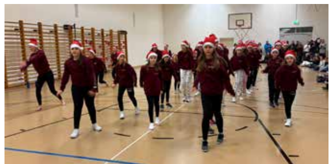
Das gemeinsame Schlussbouquet

Zum Abschluss und Höhepunkt kamen alle Gruppen zusammen, um das Publikum mit einer gemeinsamen Weihnachtschoreografie zu verzaubern. Dieser magische Moment, geprägt von Teamgeist, Freude und Begeisterung, machte den Abend zu einem unvergesslichen Erlebnis. Ein grosses Dankeschön an alle Tänzerinnen, Trainerinnen und Unterstützer, die diesen besonderen Abend möglich gemacht haben! Wir freuen uns schon auf die nächsten Auftritte.