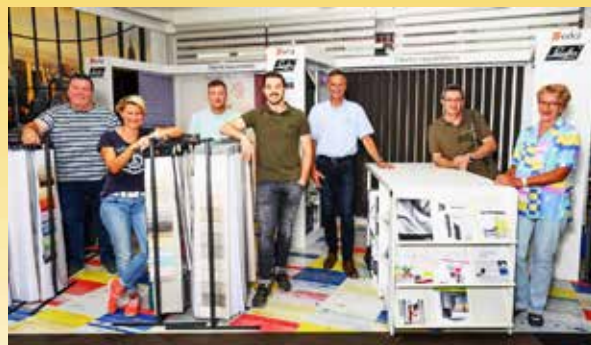
Team Mössinger AG

DieRaumausstatter.ch Mühlemattstr. 27, 4104 Oberwil Tram 10 / Bus 61+64 (Hüslimatt)