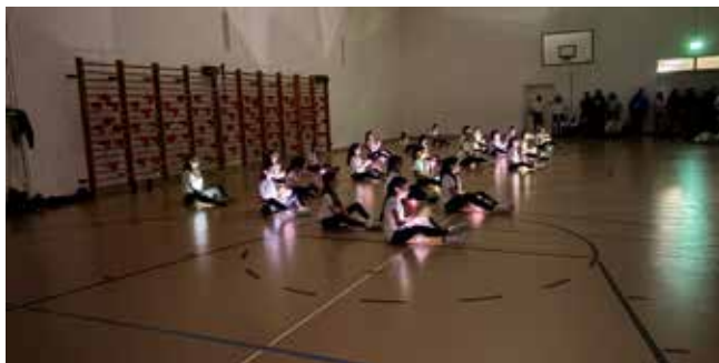
Die kleinsten beginnen in der dunklen Halle ...