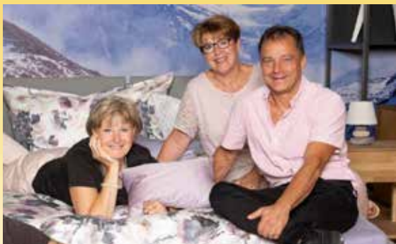
Team Bettenhaus Bella Luna