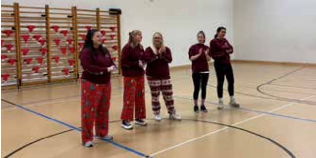
Begrüssung durch das Leiterteam

Unser diesjähriger Weihnachtsauftritt war ein voller Erfolg, und wir sind unglaublich stolz auf die Leistung unserer vier Move'n'Dance-Gruppen!