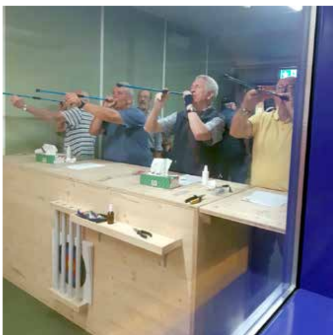
Volle Konzentration beim Blasrohrschieszen